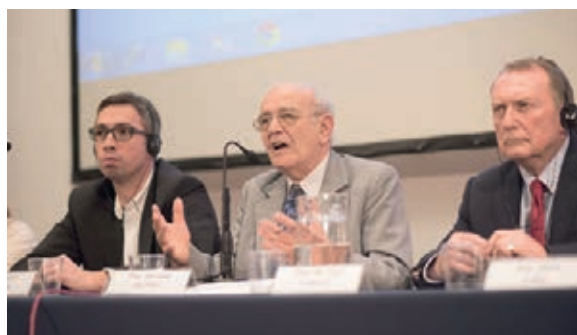
En la Mesa de Clausura.

Se presentaron también trabajos sobre desarrollo psicomotor: métodos para la evaluación del desarrollo en individuos y en grupos de población . El programa