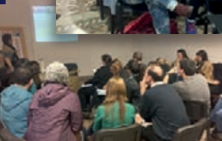
Pediatras de distintas provincias y localidades colmaron el auditorio