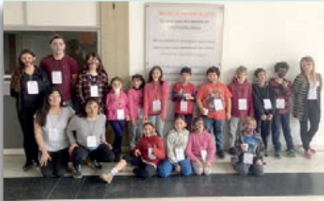
Un agradecimiento especial a los niños que colaboraron en el simulacro