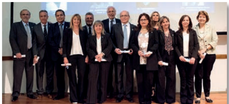
La Comisión Directiva 2015-2017 recibe el reconocimiento de sus pares