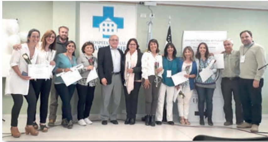
En el acto de cierre, manifestaron todos la satisfacción de culminar la última Jornada de la gestión 2015-2017, rica en matices y consistente en sus objetivos

Coincide con estas Jornadas, la semana de Los Derechos de