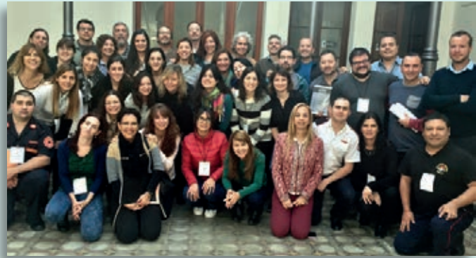
Docentes y alumnos comparten 36 horas de intenso trabajo

Del 16 al 19 de agosto tuvo lugar en la ciudad de Córdoba el Curso Intensivo Pediatría en Desastres (PEDs Pediatric in Disasters) que el Comité de Emergencias y Cuidados Críticos en Pediatría desarrolla en el marco del acuerdo de la Sociedad Argentina de Pediatría con la Academia Americana de Pediatría.