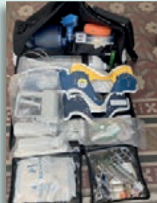
La Fundación Bomberos de Argentina aporta su conocimiento y experiencia